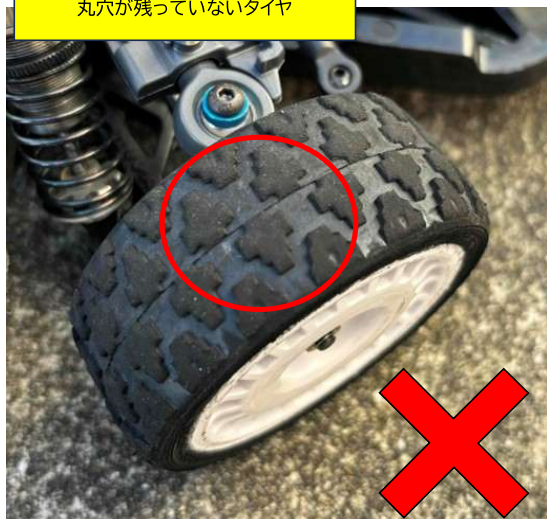
丸穴が残っていないタイヤ